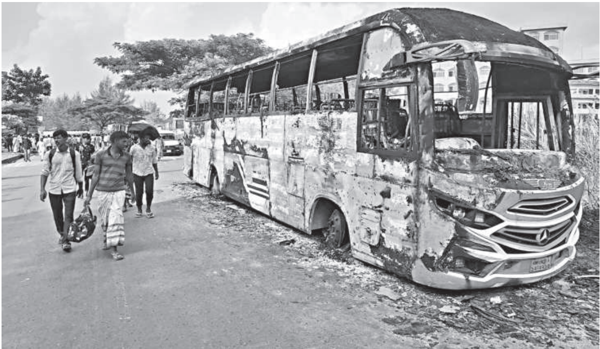
Students of Barishal University set fire to this bus on Wednesday night after a BU student was killed by a Narayanganj Paribahan bus the same day. The burnt carcass of the bus is yet to be removed from the spot. The photo was taken in front of the university yesterday.

Colonel Malik Medical College in Manikganj has been renamed as Manikganj Medical College, Abdul Malek Ukil Medical College in Noakhali as Noakhali Medical College, and Sheikh Hasina Medical College in Jamalpur as Jamalpur Medical College, Sheikh Hasina Medical College in Tangail renamed as Tangail Medical College, Bangabandhu Sheikh Mujib Medical College in Faridpur as Faridpur Medical College, and M Abdur Rahim Medical College in Dinajpur as Dinajpur Medical College, said the circular.