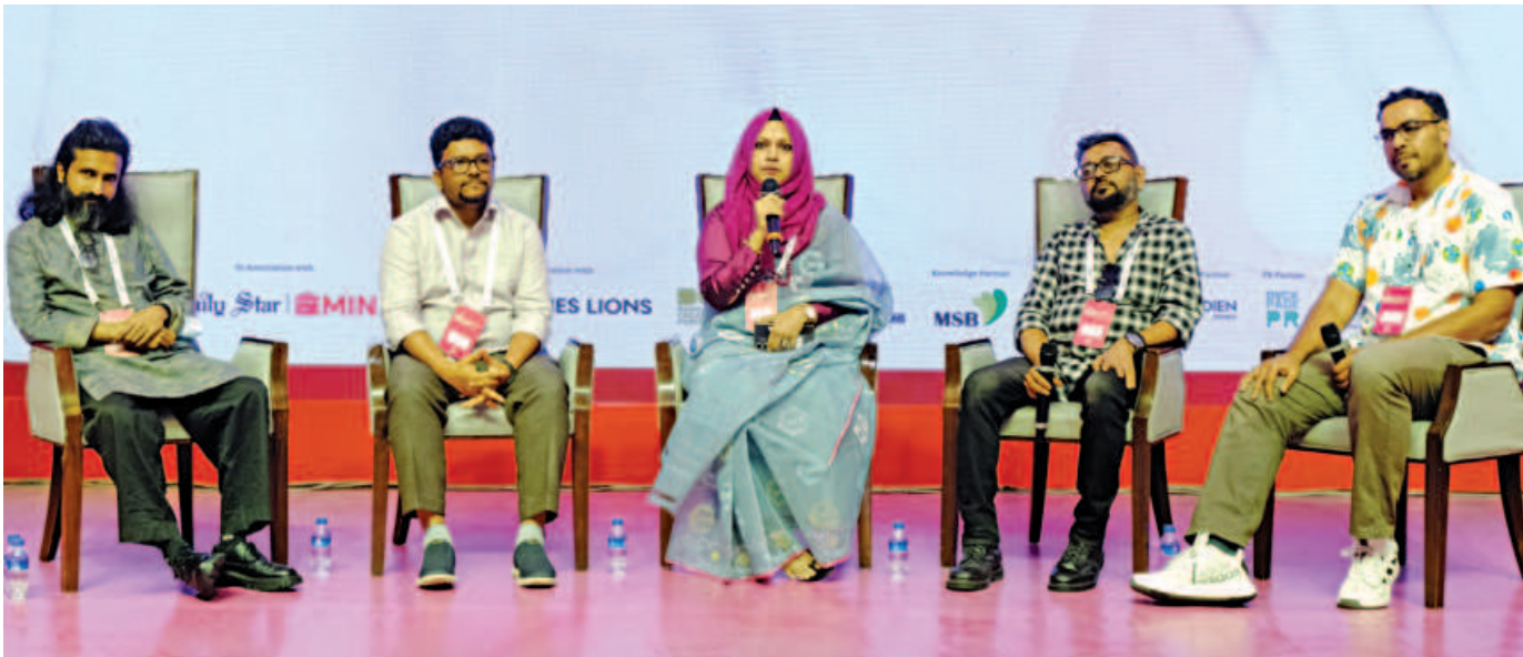
Experts take part in a panel discussion at the 13th Communication Summit at the Le Méridien Dhaka yesterday.