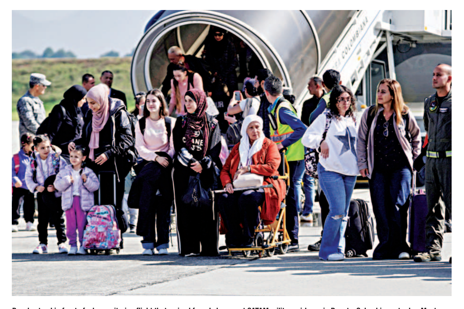
People stand in front of a humanitarian flight that arrived from Lebanon, at CATAM military airbase, in Bogota, Colombia yesterday. Most Western countries have urged their citizens to leave Lebanon as Israel launched a ground incursion on Tuesday, escalating the risk of a

Khamenei personally ordered a barrage of around 200 missiles to be fired at Israel on Tuesday, a senior Iranian official said. The attack was retaliation for the deaths of Nasrallah and Nilforoushan, the Revolutionary Guards said in a statement.