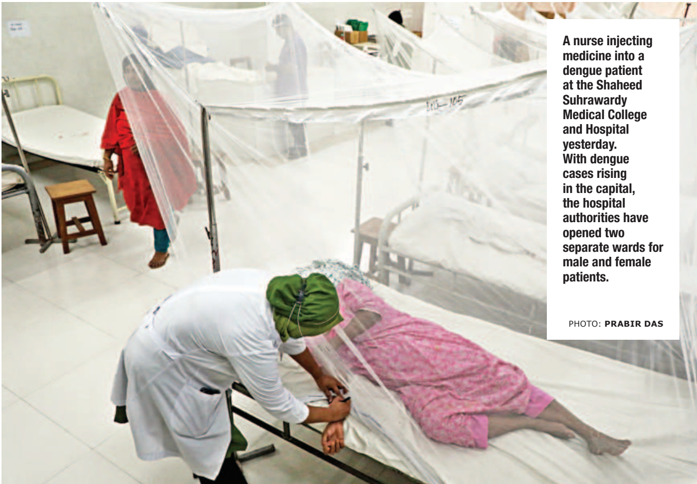
A nurse injecting medicine into a dengue patient at the Shaheed Suhrawardy Medical College and Hospital yesterday. With dengue cases rising in the capital, the hospital authorities have opened two separate wards for male and female patients.