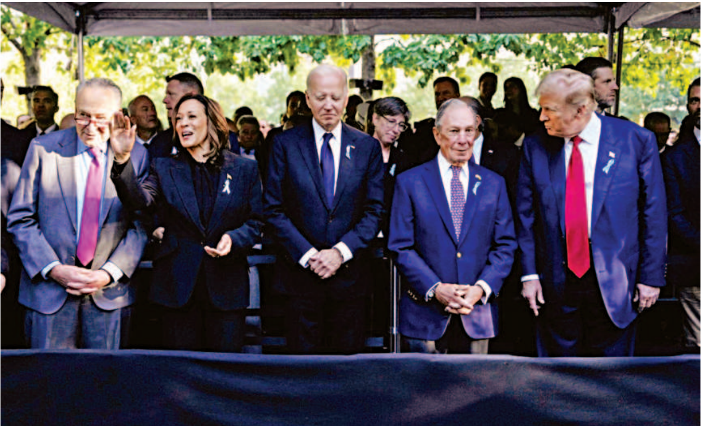
Senate Majority Leader Chuck Schumer (D-NY), US Vice President and Democratic presidential candidate Kamala Harris, US President Joe Biden, former Mayor of New York Michael Bloomberg and former US president and Republican presidential candidate Donald Trump attend a remembrance ceremony on the 23rd anniversary of the September 11 terror attack on the World Trade Center at Ground Zero, in New York City yesterday. Harris and Trump shook hands yesterday at the memorial, hours after they clashed in a combustible TV debate.

Typhoons in the region are forming closer to the coast, intensifying more rapidly, and staying over land longer due to climate change.