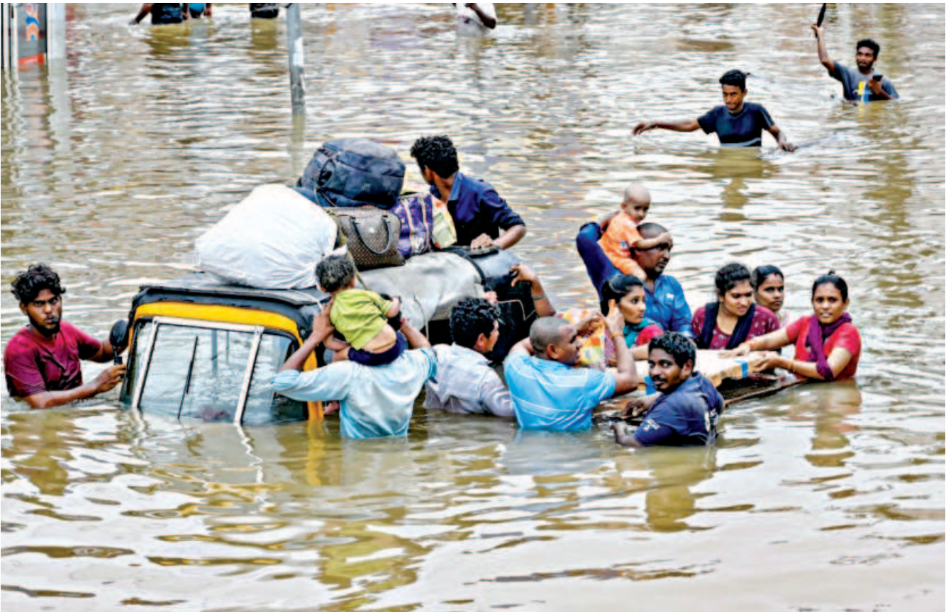
People carry their belongings as they wade through a flooded street after heavy monsoon rains in Vijayawada of Andhra Pradesh yesterday. Intense monsoon rains and floods in India's southern states have killed at least 25 people, with thousands rescued and taken to relief camps, disaster officials said.

AFP, Stockholm Toddlers should not be allowed to watch screens at all, Sweden told parents yesterday. Children under the age of two should be kept away from digital media and television completely, the country's Public Health Agency said. Kids between the ages of two and five should be limited to a maximum of one hour of screen time a day, it said in new recommendations, while those aged six to 12 should spend no more than an hour or two a day in front of a screen. Teenagers aged 13 to 18 should be limited to two to three hours per day, the agency said. "For too long, smartphones and other screens have been allowed to enter every aspect of our children's lives," Public Health Minister Jakob Forssmed told reporters. The minister said that Swedish teens aged 13 to 16 spend six and a half hours a day on average in front of their screens, outside of school hours. The health agency also recommended that kids not use screens before going to bed and that phones and tablets be kept out of bedroom at night.