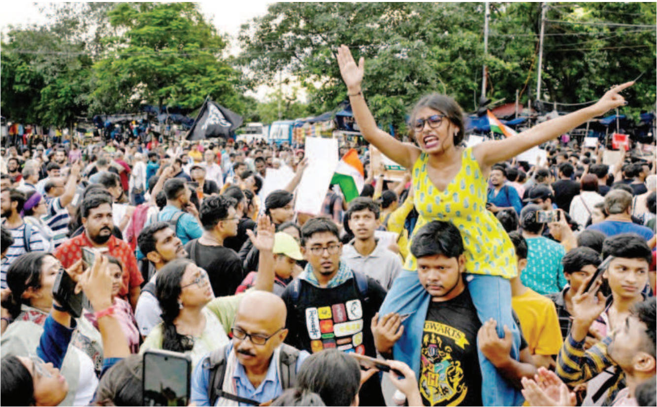
Social activists and students shout slogans during a protest march to condemn the rape and murder of a doctor, in Kolkata yesterday. The discovery of the 31-year-old doctor's bloodied body at a state-run hospital in Kolkata on August 9 stoked nationwide anger at the chronic issue of violence against women, that sparked strikes by medics and rallies backed by thousands of ordinary citizens across India.

AFP, Algiers Algeria has been approved for membership in the BRICS New Development Bank (NDB), the country's finance ministry has announced. The decision was taken on Saturday and announced by NDB chief Dilma Rousseff at a meeting in Cape Town, South Africa. By joining "this important development institution, the financial arm of the BRICS group, Algeria is taking a major step in its process of integration into the global financial system," the Algerian finance ministry said in a statement The bank of the BRICS group of nations – whose name derives from the initials of founding members Brazil, Russia, India, China and South Africa – is aimed at offering an alternative to international financial institutions like the World Bank and IMF. Algeria's membership was secured thanks to "the strength of the country's macroeconomic indicators". Created in 2015, the NDB's main mission is to mobilise resources for projects in emerging markets and developing countries. It has welcomed several country as new members, including Egypt, the United Arab Emirates, Iran and Saudi Arabia.