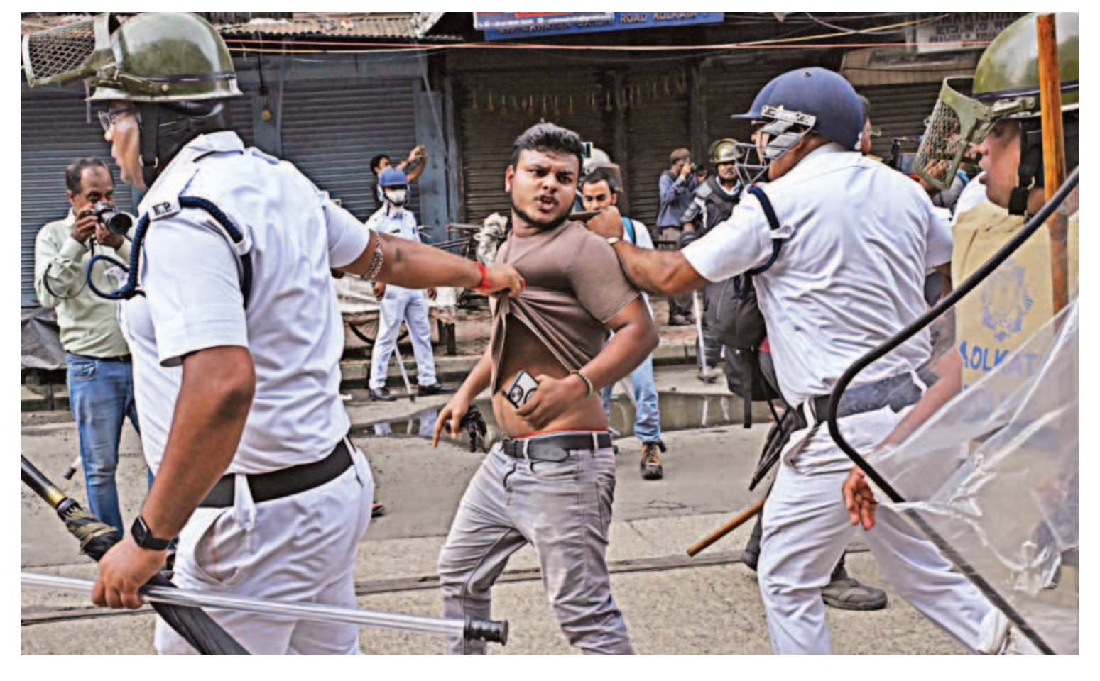
Police detain an activist as they march towards the state secretariat demanding the resignation of Mamata Banerjee, chief minister of India's West Bengal state, in Kolkata yesterday. Police in India fired tear gas and water cannon, as they clashed with thousands of protesters seeking justice for a doctor who was raped and murdered in Kolkata this month. More than 100 people were detained.

providing Without Vyacheslav evidence. Volodin, the chairman of Russia's State Duma, the lower house of parliament, earlier said the United States, through France, was attempting to exert control over Telegram.