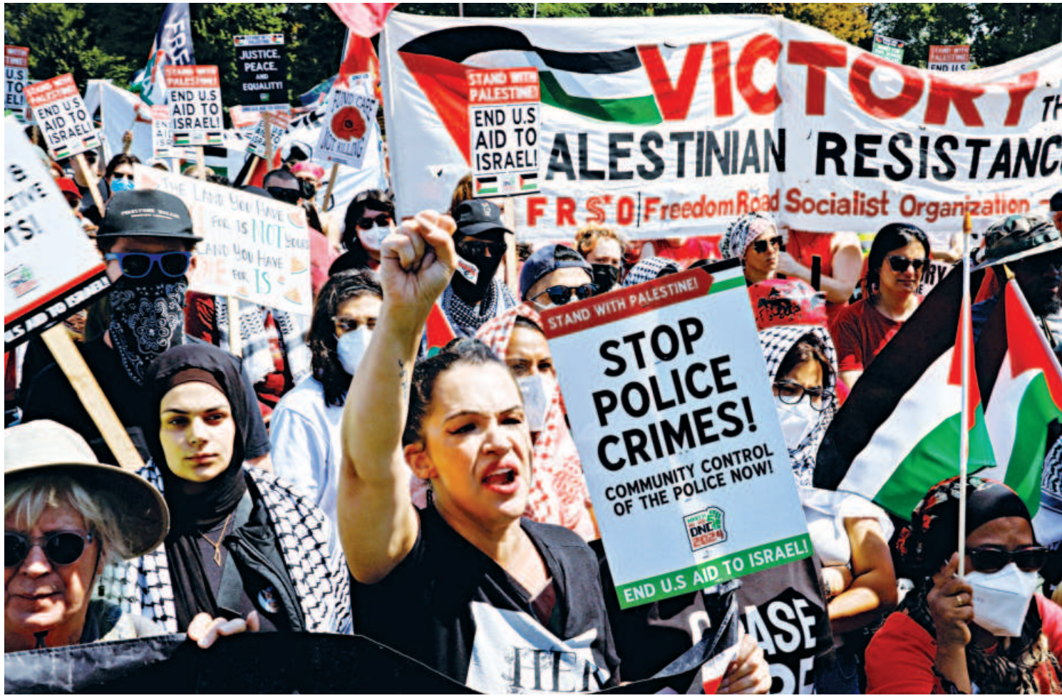
People hold signs and flags in support of Palestinians in Gaza as demonstrators rally on the sidelines of the Democratic National Convention (DNC) in Chicago, Illinois, US on Monday. Protesters briefly breached the outer security fence of the Democratic convention, hours before US President Joe Biden passed the torch to new nominee Kamala Harris.

More than 90 percent of the surveyed journalists said the city's press freedom was "significantly" impacted by a new security law enacted in March which punishes crimes like espionage and foreign interference.