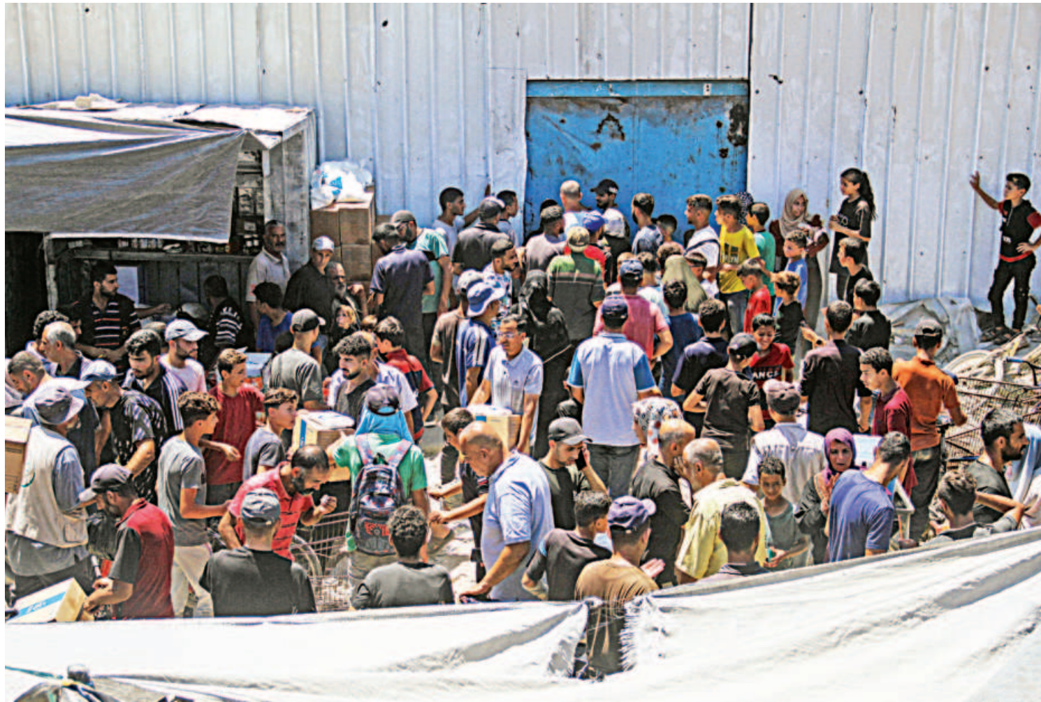
Palestinians gather to receive food at a UNRWA distribution centre amid a hunger crisis in Jabalia in the northern Gaza Strip yesterday. The health ministry in Hamas-run Gaza said that at least 39,699 people have been killed in the Israeli offensive, which is now in its 11th month.

The ex-PM, however, pointed out that he too was manhandled on May 9, as Rangers had dragged him from premises of Islamabad High Court despite the fact that he was "the most popular leader in Pakistan".