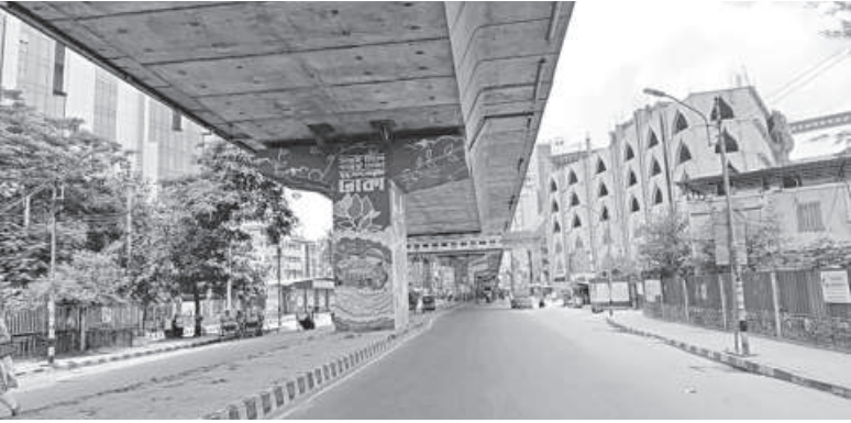
A road in Moghbazar.

Student's protest programme gained momentum as thousands of students from private universities