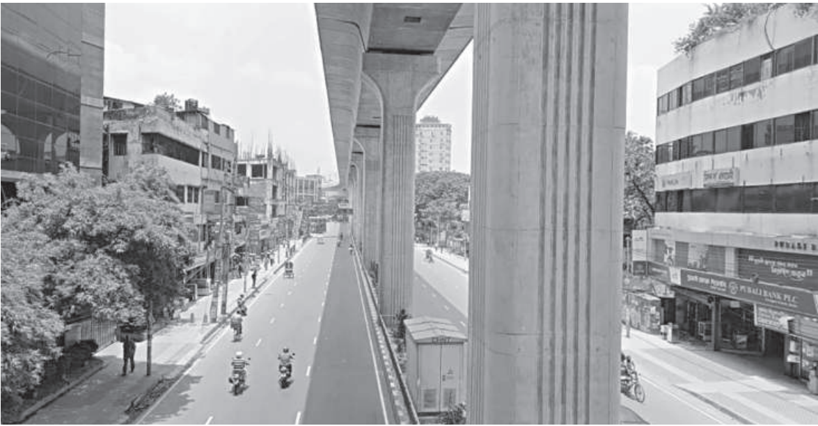
Kazi Nazrul Islam Avenue yesterday.

The PM said the investors will get all kinds of support from Bangladesh Investment Development Authority as Bangladesh offers many facilities for them.