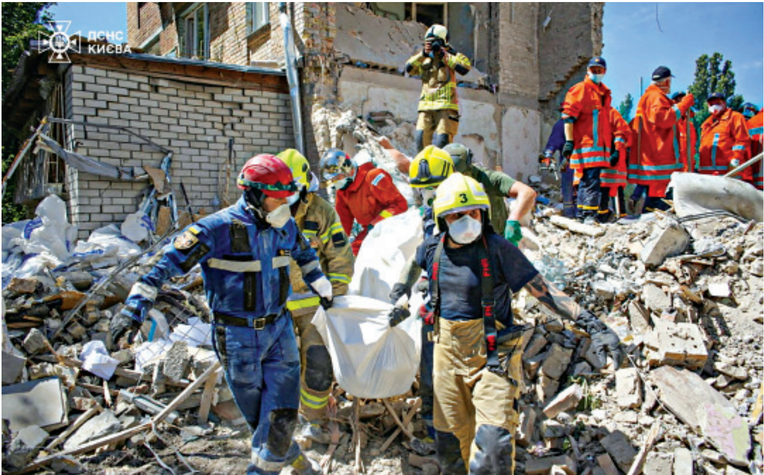
Rescuers carry the body of a person found under debris at the site where an apartment building was hit by a Russian missile strike in Kyiv, Ukraine yesterday. Targeting hospitals in Ukraine is a “war crime,” a senior UN official told an emergency meeting of the Security Council yesterday, called in the wake of deadly strikes that Kyiv blamed on Russia.

In an operation coordinated by Security Services of Ukraine and the country's military