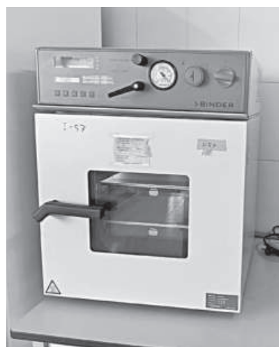
The chemistry and microbiology labs, filled with facilities, lie abandoned at Modern Food Testing Laboratory in Chattogram.