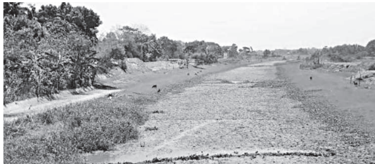
A dried up Harihar river in Keshabpur upazila of Jashore.