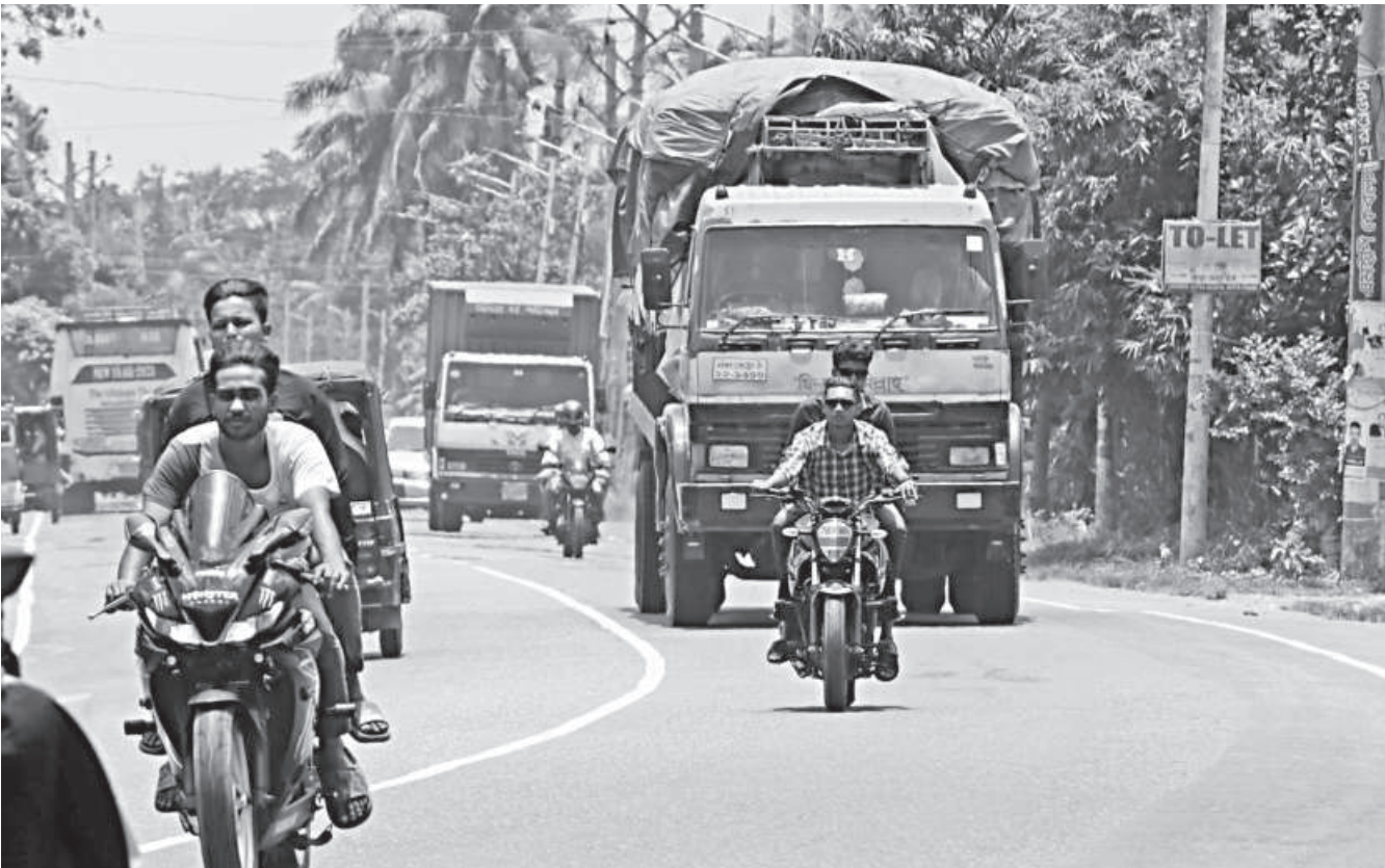
These motorcyclists ride on the Barishal-Dhaka highway without wearing helmets. Such actions increase the risk of fatalities in case of accidents. The photo was taken recently.

The Directorate General of Food yesterday informed that no rice was imported in the 2023-2024 fiscal year, which happened for the first time in many years. It disclosed the information at a meeting of the parliamentary standing committee on food ministry, held at Jatiya Sangsad Bhaban. Directorate General of Food imports rice and wheat through international tenders or G2G basis, and in the fiscal year, no rice has been imported at the government or private level, it said. The country's rice production has met the demand for rice in the local market. However, wheat was imported following due process, it also informed. Mentionable, around 10 lakh tonnes of rice was imported in the 2022-23 fiscal year. The meeting was also told that plans have been adopted to discourage food waste through the Bangladesh Food Safety Authority. It was also recommended in the meeting to conduct public awareness activities for preventing food wastage.