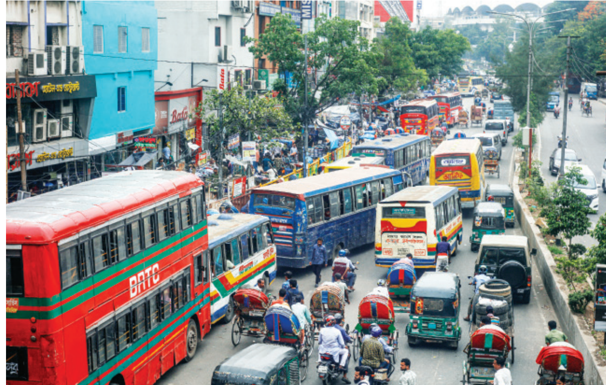
Buses waiting to pick up passengers occupy almost all the road at the capital's Mirpur-10 intersection yesterday afternoon, causing a tailback. Such activities are one of the main reasons behind gridlocks in the city.