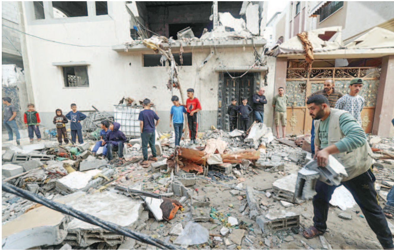
Palestinians clear building rubble following Israeli bombardment in Rafah in the southern Gaza Strip yesterday. In war-torn Gaza, 2.4 million Palestinians have struggled on under bombardment while enduring dire shortages of food, water, fuel and other basic supplies.

"The synchronized drone operations were simultaneously executed against Naypyitaw, targeting both the headquarters of the terrorist military and Alar Air Base," the NUG said in a statement. "Preliminary reports suggest there were casualties."