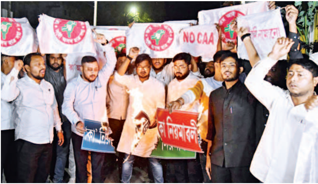
Activists of All Assam Students' Union (AASU) set alight copies of Indian government's Citizenship Amendment Act (CAA) during a protest in Guwahati yesterday.