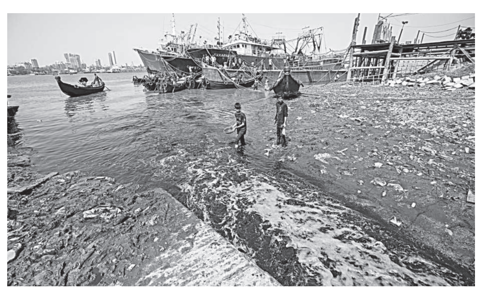
Dead fish, crabs, and other aquatic creatures appear on the surface of the Karnaphuli, a river that now chokes on a thick layer of dissolved burnt sugar following a fire at a sugar refinery in Chattogram. The photo was taken yesterday.