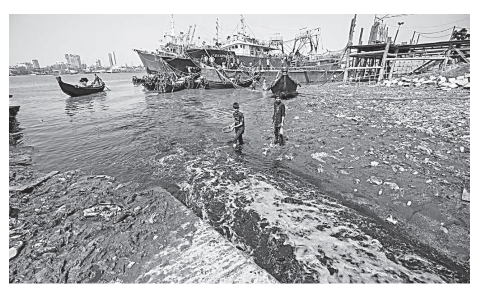
Dead fish, crabs, and other aquatic creatures appear on the surface of the Karnaphuli, a river that now chokes on a thick layer of dissolved burnt sugar following a fire at a sugar refinery in Chattogram. The photo was taken yesterday.