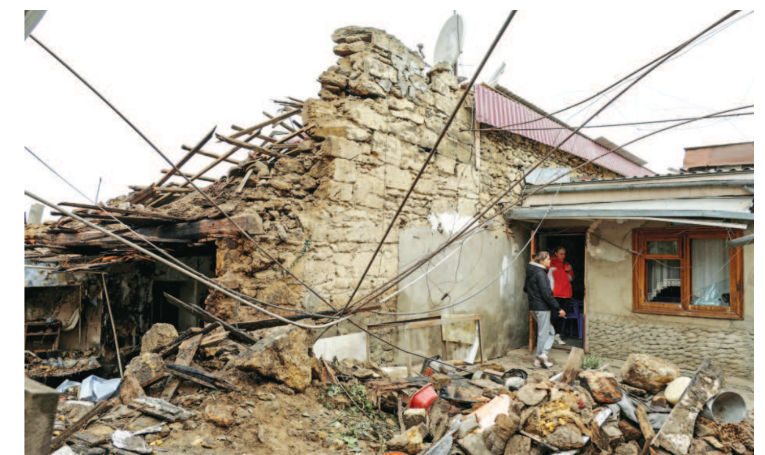
Local women stand next to their house heavily damaged by a Russian drone strike, amid Russia's attack on Ukraine, in Odesa, February yesterday.

"(That) is rooted in Iran's adherence to international law and the UN Charter."