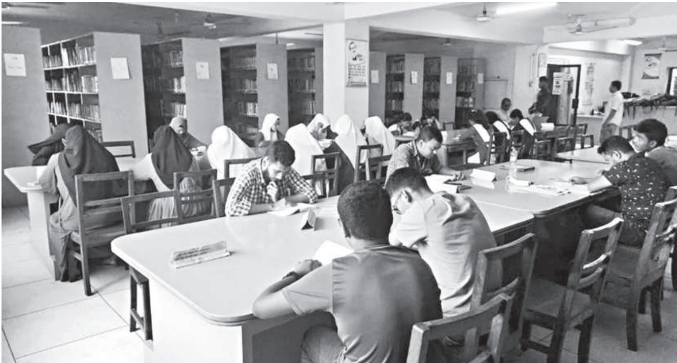
While the early heritage of Annoda Gobinda Public Library has been replaced with modern facilities over the years, one thing that remains unchanged is its crowd of avid readers.