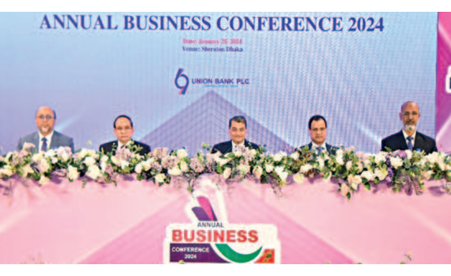
Conference-2024" of the bank in Dhaka yesterday.

This card will empower customers to access ATMs, make merchant payments (online and offline) and digital media marketing payments.