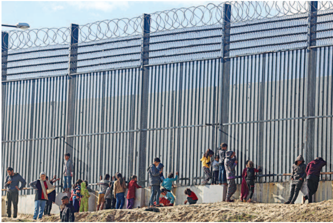
Palestinians stand by the border fence with Egypt at a makeshift tent camp for displaced Palestinians in Rafah in the southern Gaza Strip yesterday, as Israeli forces have intensified their offensive in the Palestinian enclave.

"This unacceptable act undermines years of cooperation, blatantly violates Iraq's sovereignty and contributes to a reckless escalation... at a time when the region is already grappling with the danger of expanding conflict," said a spokesman for Iraqi Prime Minister Mohamed Shia al-Sudani.