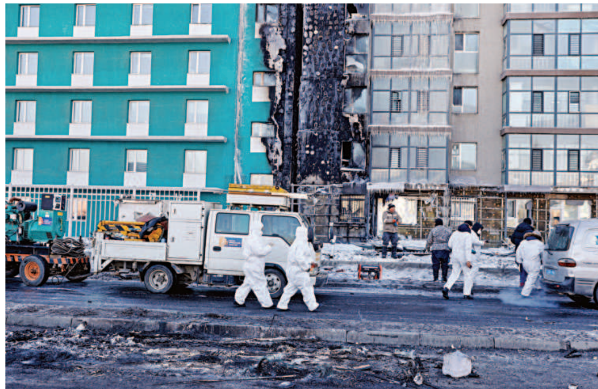
Experts in PPE walk to a building damaged by an explosion after a truck carrying liquefied natural gas crashed, in Ulaanbaatar, Mongolia yesterday. At least six people, including three firefighters, were killed and 11 people were injured in the fire near the Dunjingarav market, Mongolia's Emergency Management Office said.

The Trinamool Congress will contest the elections for West Bengal's 42 Lok Sabha seats on its own steam, and only consider a pan-India alliance with the Congress after results are declared, a furious Mamata Banerjee declared yesterday. Banerjee's words deliver what appears to be a final blow to hopes the two parties - widely seen as important members of the INDIA opposition bloc - will reach any agreement. "I had no discussions with the Congress. I have always said that in Bengal, we will fight alone. I gave them (the Congress) many proposals... but they rejected them. I am not concerned about what will be done in the (rest of the) country... but we are a secular party and, in Bengal, we alone will defeat BJP," she said.