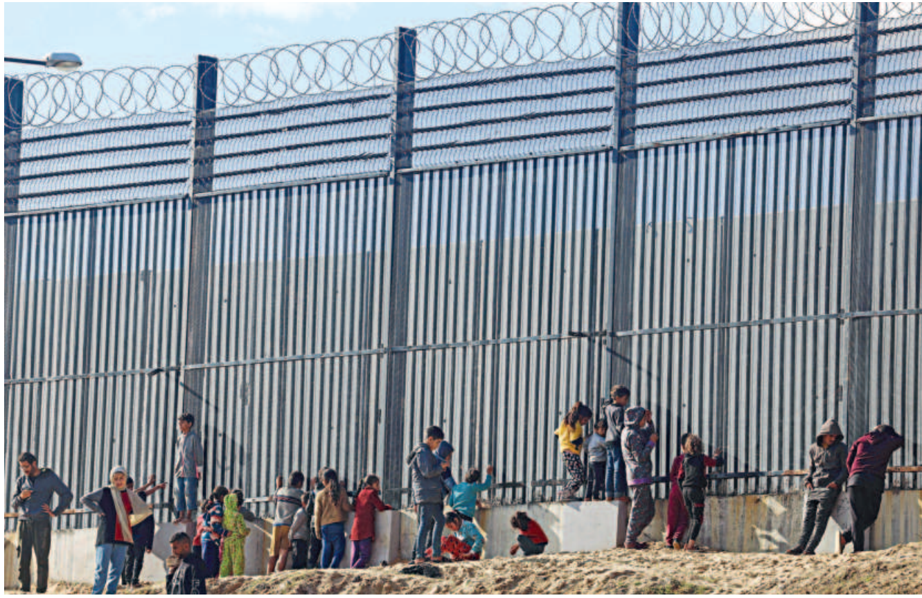
Palestinians stand by the border fence with Egypt at a makeshift tent camp for displaced Palestinians in Rafah in the southern Gaza Strip yesterday, as Israeli forces have intensified their offensive in the Palestinian enclave.

"This unacceptable act undermines years of cooperation, blatantly violates Iraq's sovereignty and contributes to a reckless escalation... at a time when the region is already grappling with the danger of expanding conflict," said a spokesman for Iraqi Prime Minister Mohamed Shia al-Sudani.