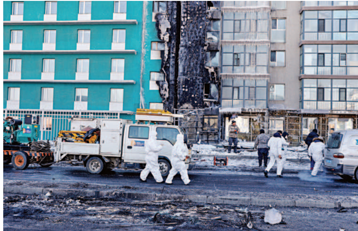
Experts in PPE walk to a building damaged by an explosion after a truck carrying liquefied natural gas crashed, in Ulaanbaatar, Mongolia yesterday. At least six people, including three firefighters, were killed and 11 people were injured in the fire near the Dunjingarav market, Mongolia's Emergency Management Office said.

The Trinamool Congress will contest the elections for West Bengal's 42 Lok Sabha seats on its own steam, and only consider a pan-India alliance with the Congress after results are declared, a furious Mamata Banerjee declared yesterday. Banerjee's words deliver what appears to be a final blow to hopes the two parties - widely seen as important members of the INDIA opposition bloc - will reach any agreement. "I had no discussions with the Congress. I have always said that in Bengal, we will fight alone. I gave them (the Congress) many proposals... but they rejected them. I am not concerned about what will be done in the (rest of the) country... but we are a secular party and, in Bengal, we alone will defeat BJP," she said.