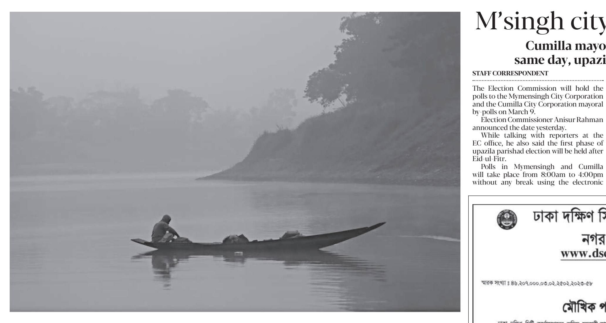
With the sun yet to peek through the fog, a fisherman sets off to Surma river on his small dinghy early yesterday.