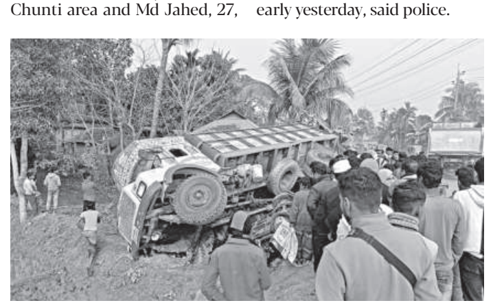
took place around 2:45pm at The overturned truck after it rammed a battery-run auto-Bhabkirmor Cherumondol area rickshaw on Mymensingh-Tangail highway, killing three persons including a mother and child yesterday.

to Muktagacha Upazila Health Rangunia thana.