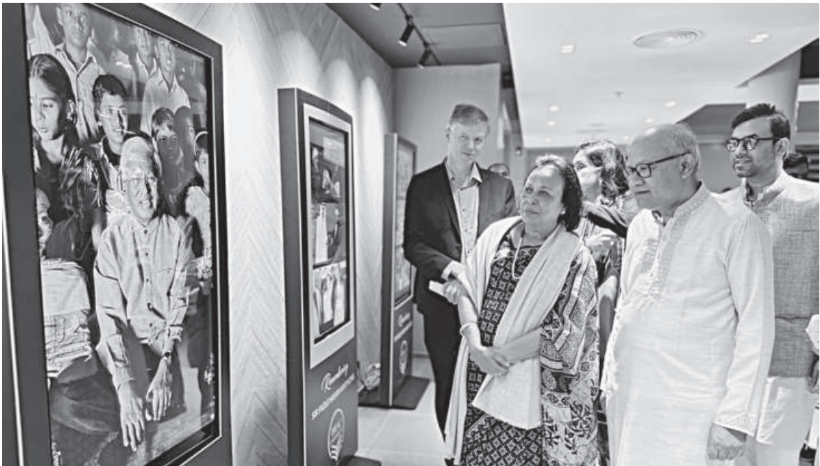
Visitors at a digital photo exhibition, showcasing Sir Fazle Hasan Abed's journey, at BRAC University in Dhaka yesterday. The event was held marking his fourth death anniversary.