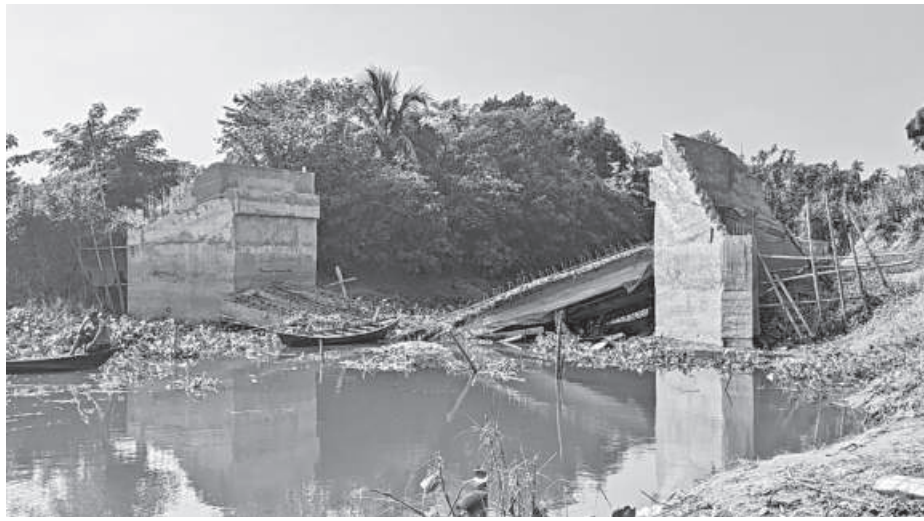
Collapsing during construction, this bridge in Narsingdi Sadar upazila's Chardighaldi union remains unrepaired for the last six months.