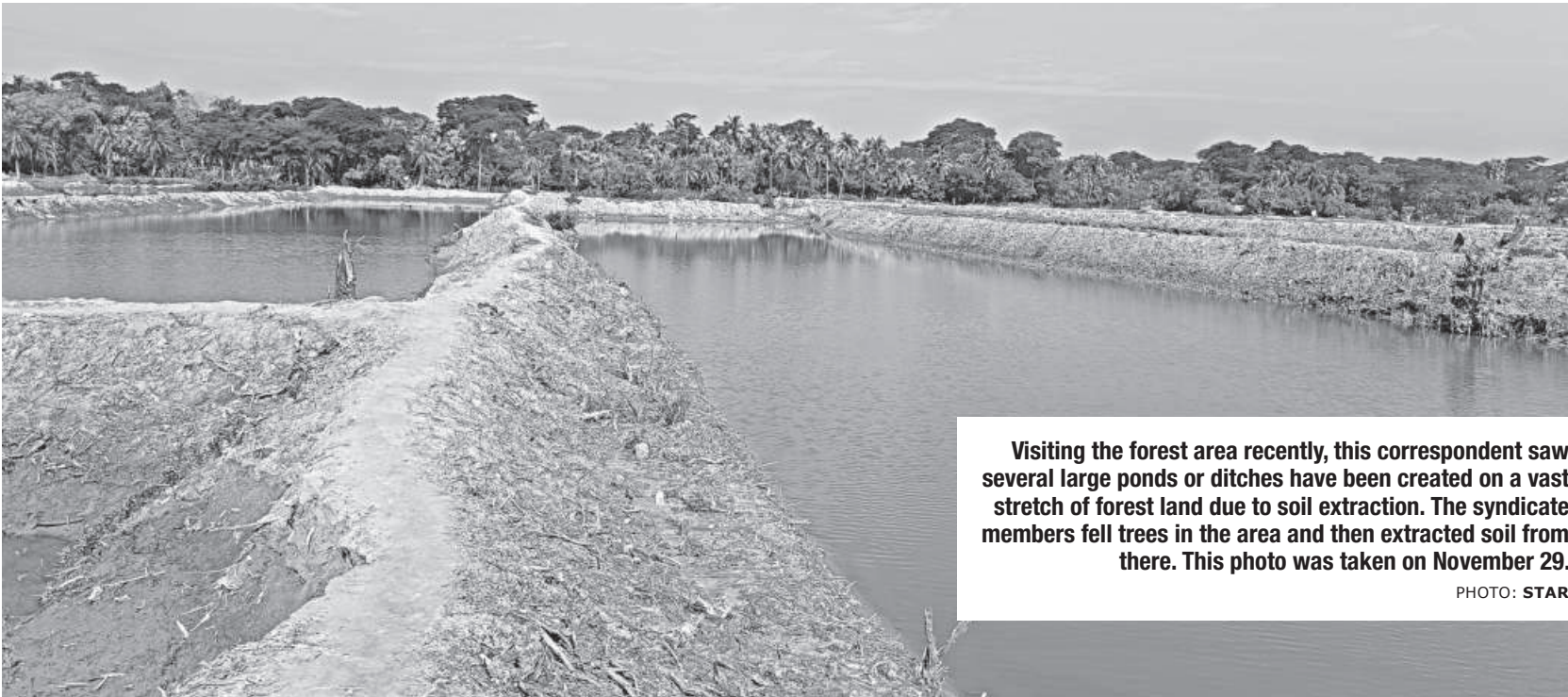
Visiting the forest area recently, this correspondent saw several large ponds or ditches have been created on a vast stretch of forest land due to soil extraction. The syndicate members fell trees in the area and then extracted soil from there. This photo was taken on November 29.

Miscreants fell over 10,000 trees to extract soil in Gangamati Reserve Forest