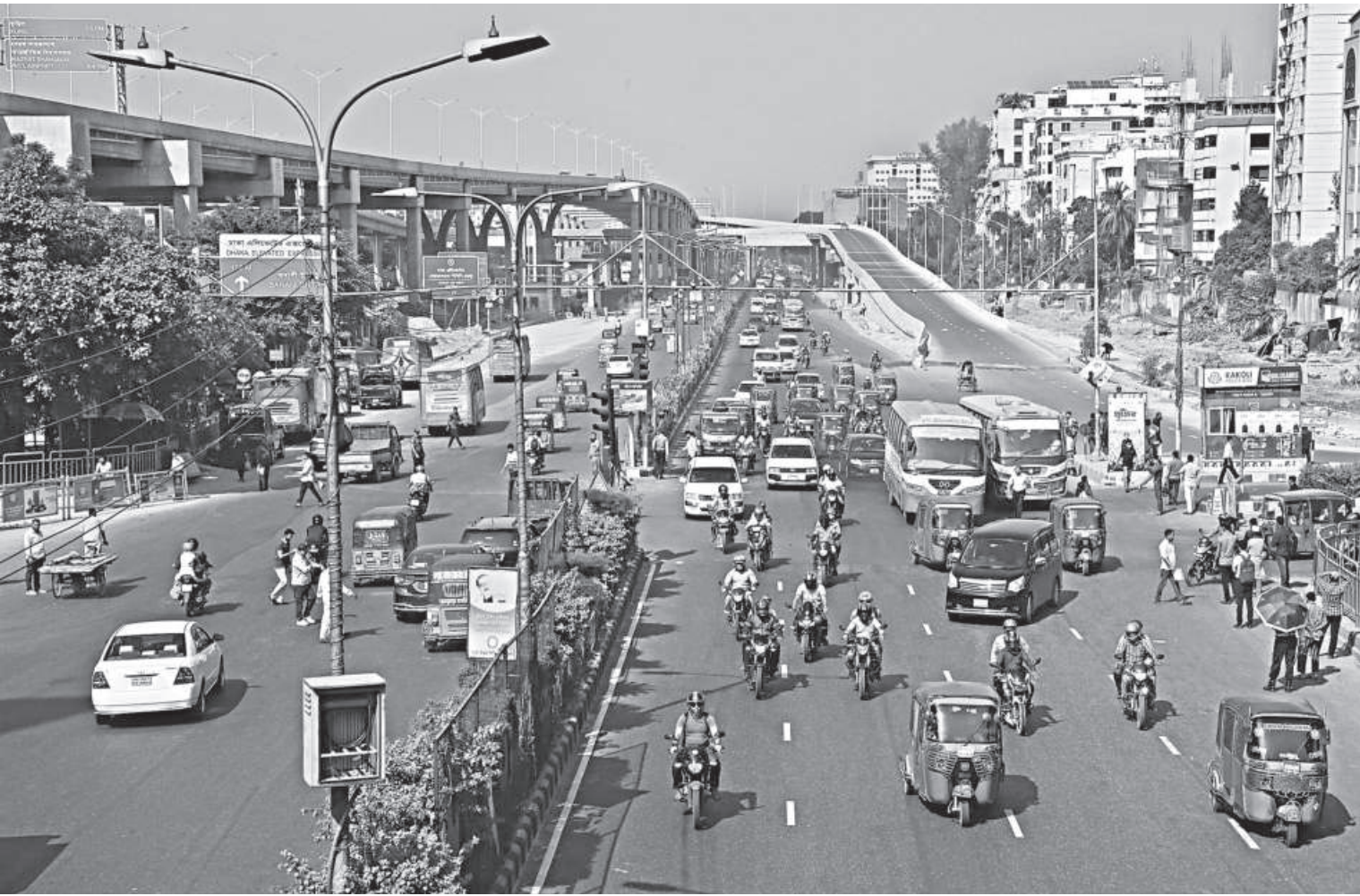
Compared to the last two days, more vehicles, including buses, were seen plying Dhaka roads yesterday amid the countrywide three-day blockade, which ended yesterday. The photo was taken in Banani.