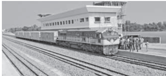
The Akhaura-Agartala rail line.

Initially, the project was scheduled to be completed within May, 2020. But it experienced both time and cost overruns. The construction work of the approximately 90km rail line was completed at a cost of Tk 4,260 crore.