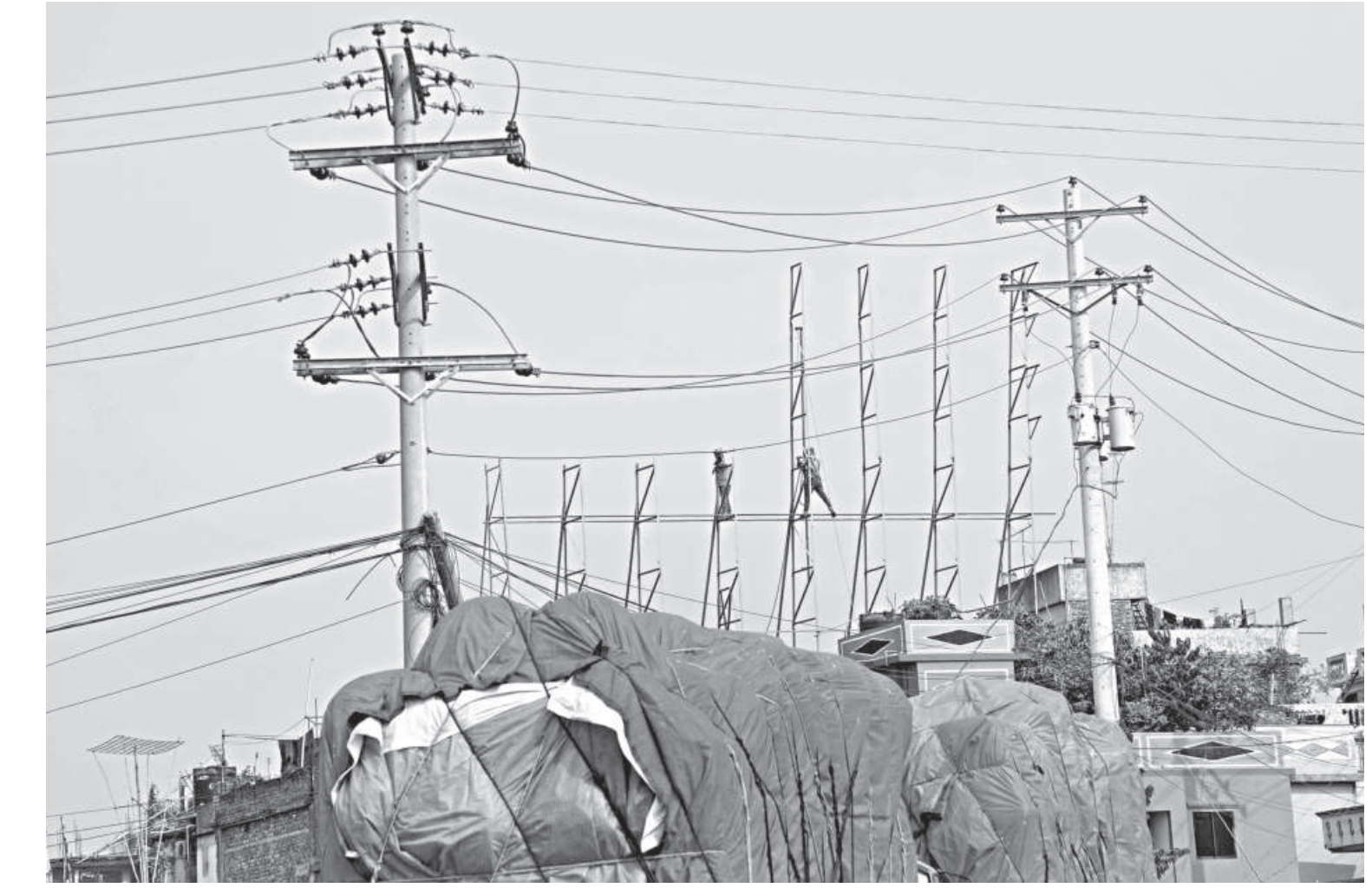
Without any safety gears, two men work on a billboard frame in Savar's Amin Bazar area yesterday. There continues to be a lack of significant measures to ensure workplace safety for workers.

police officials, meanwhile, The demanded formation of a separate unit to prevent hill cutting.