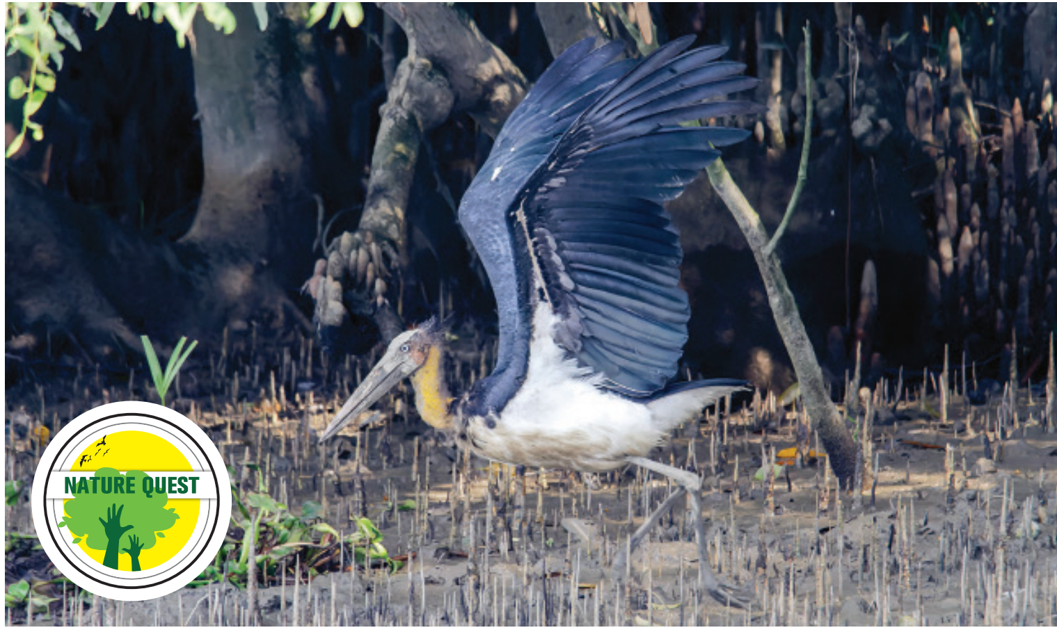
READY FOR TAKE-OFF ... A lesser adjutant spotted in the Sundarbans. This visually overwhelming yet harmless bird prefers hunting on land, which is why it's often found around large rivers and lakes inside well-wooded areas and also in freshwater and coastal wetlands from India through Southeast Asia. However, like other waterbirds, lesser adjutant populations appear to be greatly at risk due to hunting and habitat destruction, prompting the IUCN to put them in the "Vulnerable" category of its Red List.