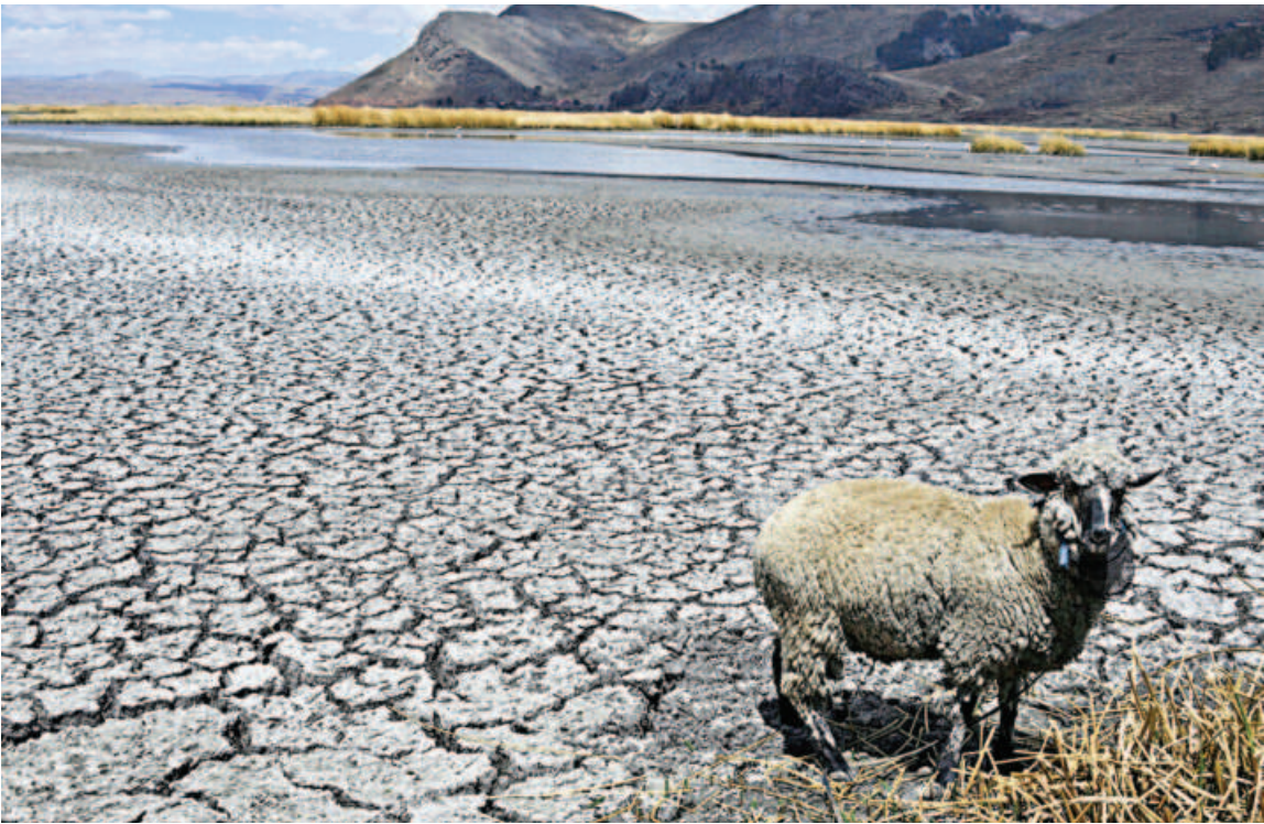
A sheep stands on cracked earth in the Bahia (Bay) Cohana area of Lake Titicaca, shared by Bolivia and Peru, in the Bolivian Altiplano on Friday. Lake Titicaca’s water levels are at historic lows due to climate change and a severe drought.

REUTERS, Seoul US Secretary of State Antony Blinken and South Korean, Japanese counterparts expressed “serious concern” over the discussion of military cooperation between Russia and North Korea, including possible arms trade, South Korea’s Foreign Ministry said today. Blinken, South Korea’s Foreign Minister Park Jin and Japan’s Foreign Minister Yoko Kamikawa agreed to respond firmly to any acts that threaten regional security in violation of UN Security Council resolution in a brief meeting on Friday, the ministry said in a statement. North Korea’s leader Kim Jong Un made a weeklong visit to Russia last week and discussed military cooperation with Russian President Vladimir Putin. US and South Korean officials have expressed concern that the summit was aimed at allowing Russia to acquire ammunition from the North to supplement its dwindling stocks for its war in Ukraine. South Korean President Yoon Suk Yeol said on Wednesday that if Russia helped North Korea enhance its weapons programs in return for assistance for its war in Ukraine, it would be “a direct provocation” and Seoul and its allies would not stand idly by.