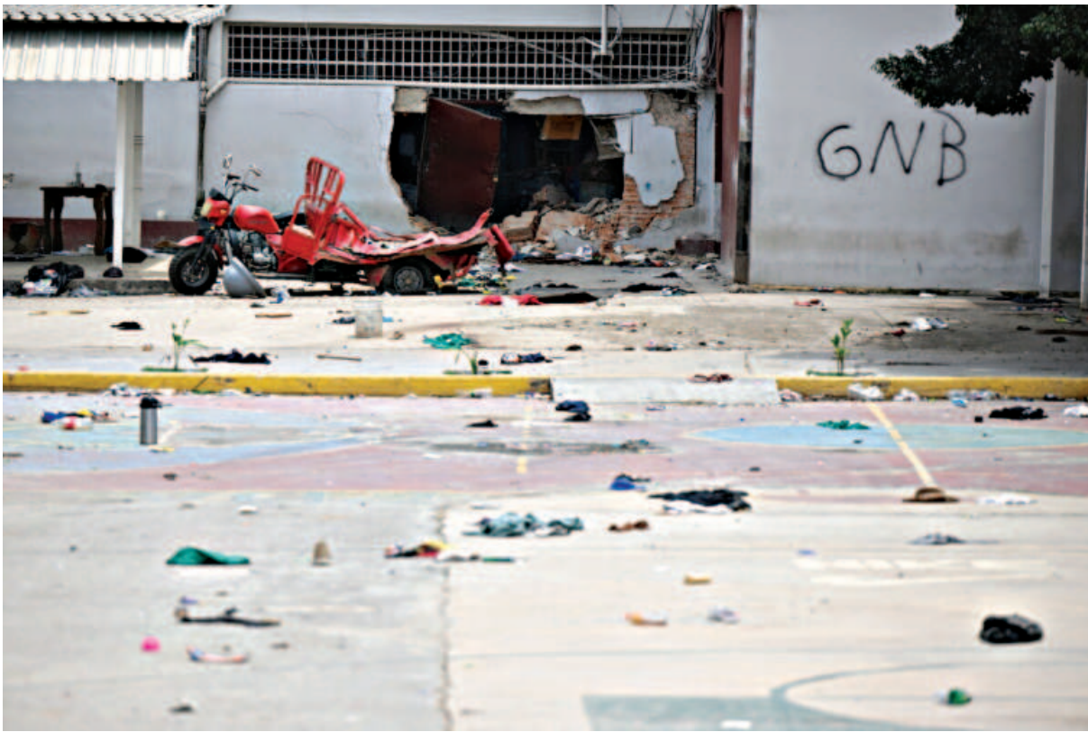
A view of a broken wall and a damaged tricycle in the Tocatoron prison in Tocatoron, Aragua State, Venezuela, taken on September yesterday.