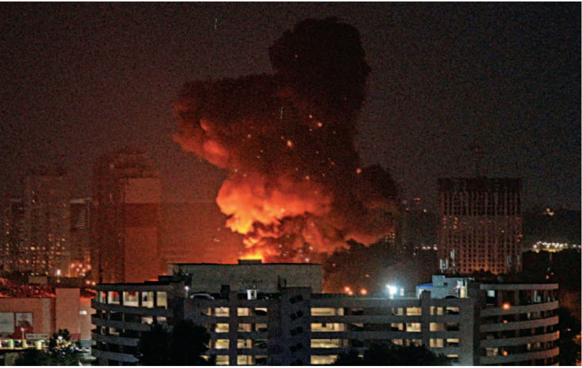
An explosion is seen in the sky over the city during a Russian missile strike, amid Russia's attack on Ukraine, in Kyiv, Ukraine yesterday. The assault left two dead and came as Russia said an airport near the border with Estonia had been targeted by drones.

"It's perfectly possible to engage with China at the same time as being very robust in standing up for our interests and our values," Sunak said.