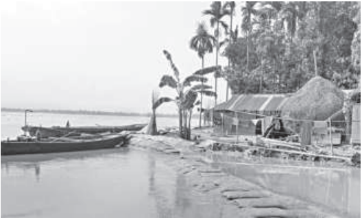
SEE PAGE 4 COL 4

Khitab Khan Government Primary School is at risk of being washed away by the river any time as the water body is only 30-35 metres away.