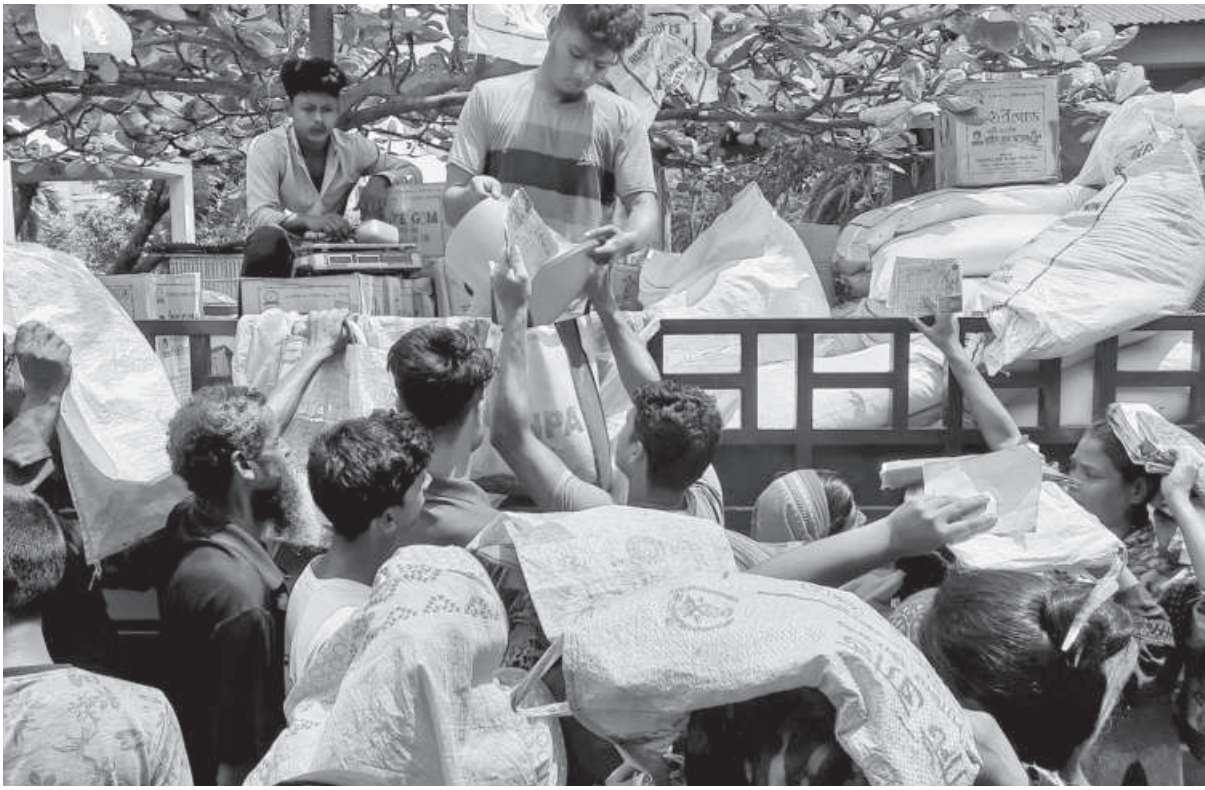
Defying the scorching heat, TCB card holders wait for hours to purchase essential commodities at subsidised prices. Due to ever-rising prices in the market, lower-income families have no choice but to rely on this service for survival. The photo was taken yesterday in Khulna's Khalishpur area.