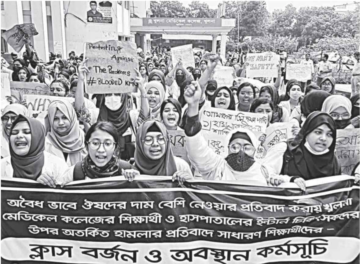
KMCH interns staged a sit-in protest yesterday, following their clash with pharmacy staffers on Monday. They said they will start a hunger strike from today if their demands are not met. The photo was taken from in front of the college.