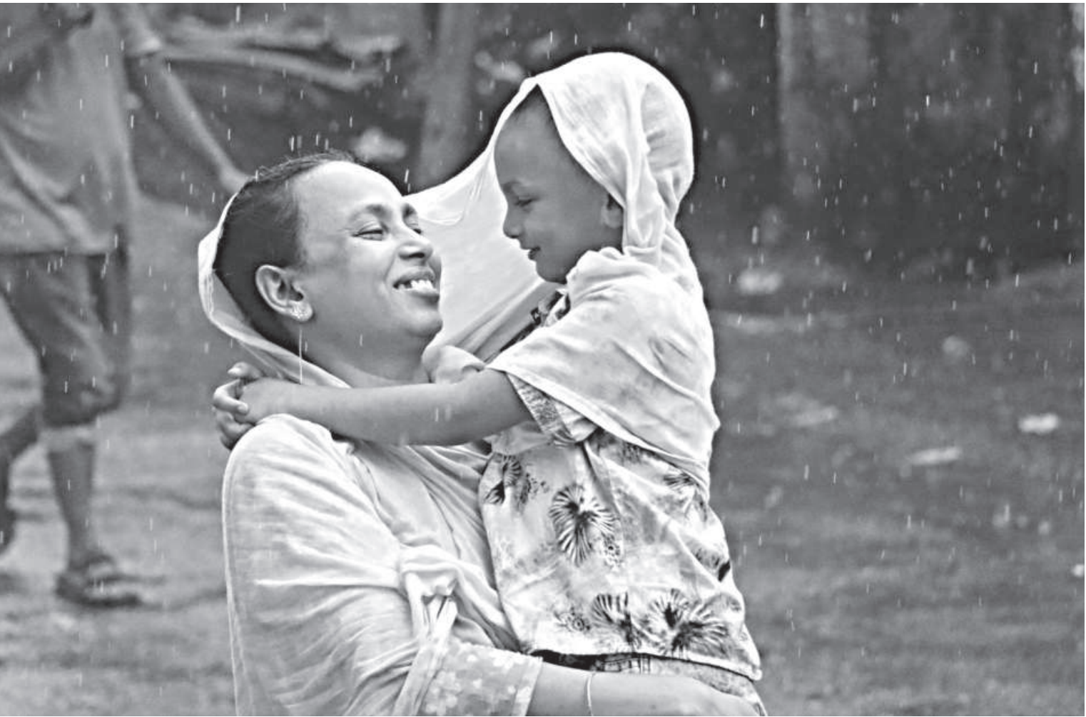
DRIZZLE DELIGHTS... Sheltering themselves from rain with a cotton scarf, a mother and her son share a moment joy on their way back home. The photo was taken recently in Barishal city's Nazir Mohalla.