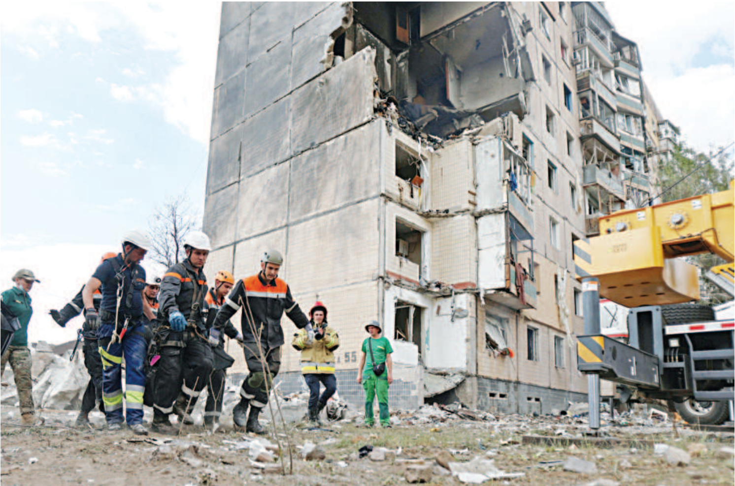
Rescuers carry the body of a resident retrieved after a nine-storey residential building was partially destroyed as a result of Russian missiles strike in Kyryvi Rig yesterday, amid the Russian invasion of Ukraine.

Around 400 members of the Jamiat Ulema-e-Islam-F (JUI-F) party -- a key government coalition partner led by a firebrand cleric -- were waiting Sunday for speeches to begin when a bomber detonated a vest packed with explosives and ball bearings near the front stage.