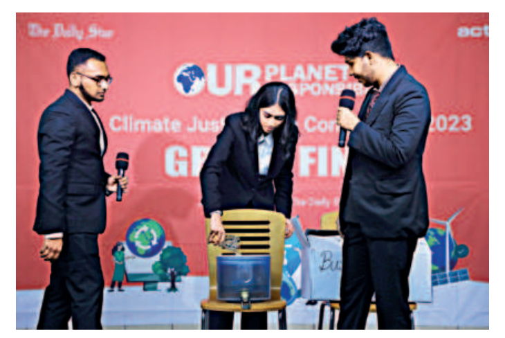
Team AlphaPi showcasing their idea during the final round.