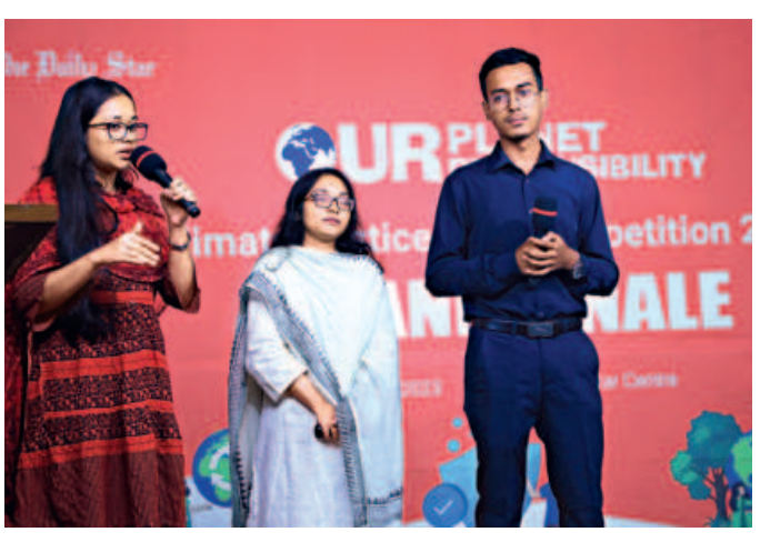
A member of Team Cerevisiae confidently answering a judge's question.