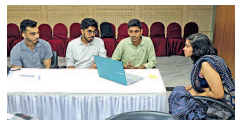
A sneak peek into the valuable mentoring session.