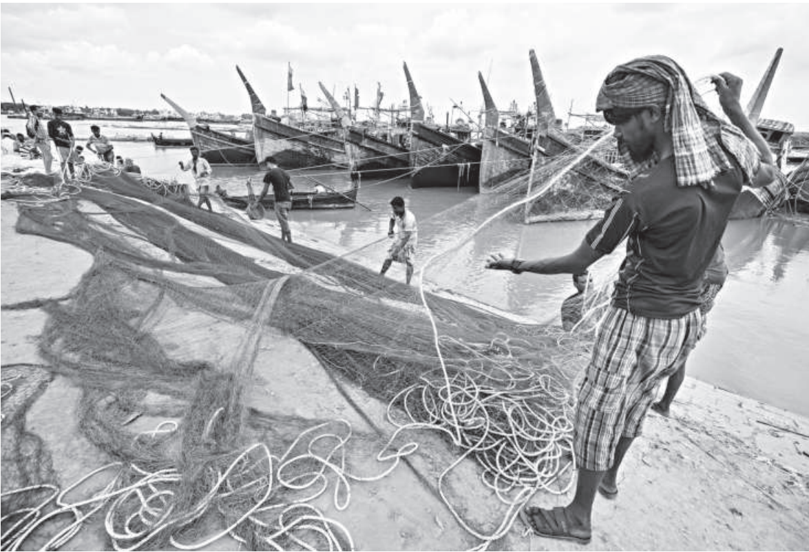
With the 65-day ban on fishing in the sea ending in four days, the banks of the Karnaphuli are buzzing with activities these days as fishers are busy mending nets. This photo was taken in the port city's Fishery Ghat area yesterday.