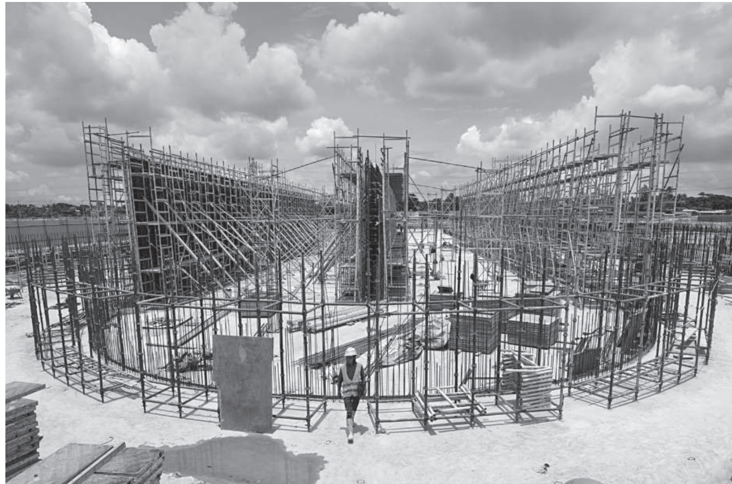
The first sewage treatment plant is under construction in the port city's Halisahar Anandabazar area. The plant, constructed on 163 acres of land, will not just ensure proper waste management system for the city dwellers but also save the Karnaphuli, a river very close to its demise due to unplanned disposal of sewage into it for years.