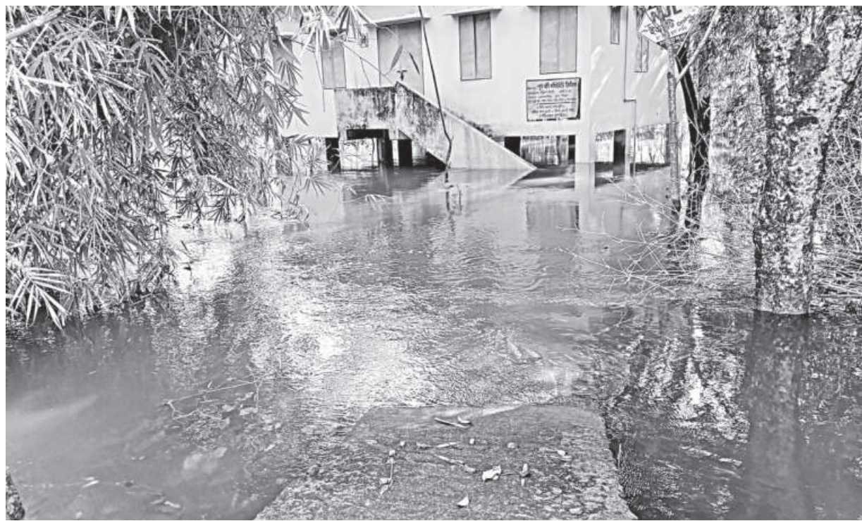
Locals of Ranikhai union in Sylhet's Companiganj suffer as the road leading to Purbo Borni community clinic remains submerged following frequent rains. Many low-lying areas in some northern and northeastern districts have inundated as rivers in the region continue to swell. The photo was taken yesterday.