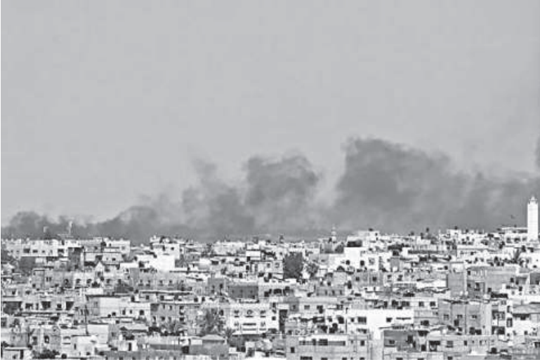
Smoke rises following an Israeli strike in Khan Younis in the southern Gaza Strip on May 9, 2023.

When it comes to Israel and Palestine, the West finds it hard to stick to their so-called moral values, because it’s politically difficult. They don’t even shy away from disjoining hands with the UN and humanitarian bodies. But if they truly care about peace, the West must come to terms with its own complicity regarding the loss of Palestinian lives. Until then, Israel will have no incentive to comply with international law and Palestinians will continue to suffer. Nakba will go on, as it does, with Israel knowing that powerful governments will stand by it.