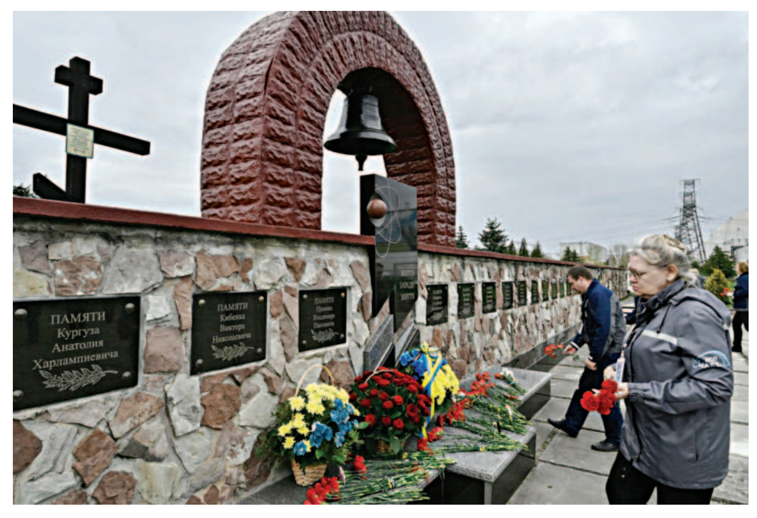
Power Plant Employees lay flowers at a memorial to commemorate the 37th anniversary of the Chernobyl nuclear disaster at the Chernobyl Power Plant yesterday amid the Russian invasion of Ukraine.