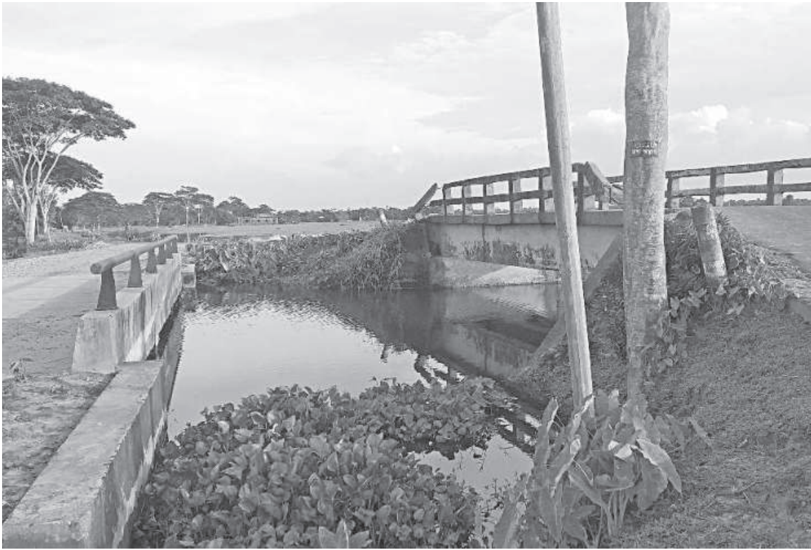
Because of this box culvert, built in Bhurbhurichara area in Moulvibazar's Rajnagar upazila, crops are rotting away on surrounding areas, as water inundates the land during monsoon.

Similarly, fertiliser shops and fish feed traders also resort to using poly bags instead of using net bags or tissue bags which are more environmentally friendly alternatives. Many shopkeepers and traders claim that they buy 1 kg (around 500 bags) of different sizes of poly bags for only Tk 250, whereas net and tissue bags are more expensive. As such, they prefer using poly bags as a cheaper and more accessible option.