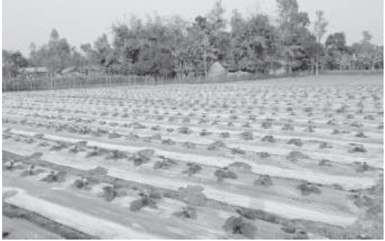
This recent photo shows a brinjal field at Kuragachha village in Tangail’s Madhupur upazila covered with mulching paper for rapid growth and better yield of the vegetables.

Mulching method, a modern farming technic for producing quality vegetables and fruits, is gaining popularity among farmers in Tangail region nowadays. It is an advanced farming method that results rapid growth of crops and vegetables. Besides, the soil is covered with mulch. Mulch is a layer of material, such as leaves, straw, grass clippings, wood chips, or other organic matter, that is spread over the soil surface around plants to conserve moisture in the soil, suppress weed growth, moderate soil temperature, reduce erosion, and improve soil fertility.