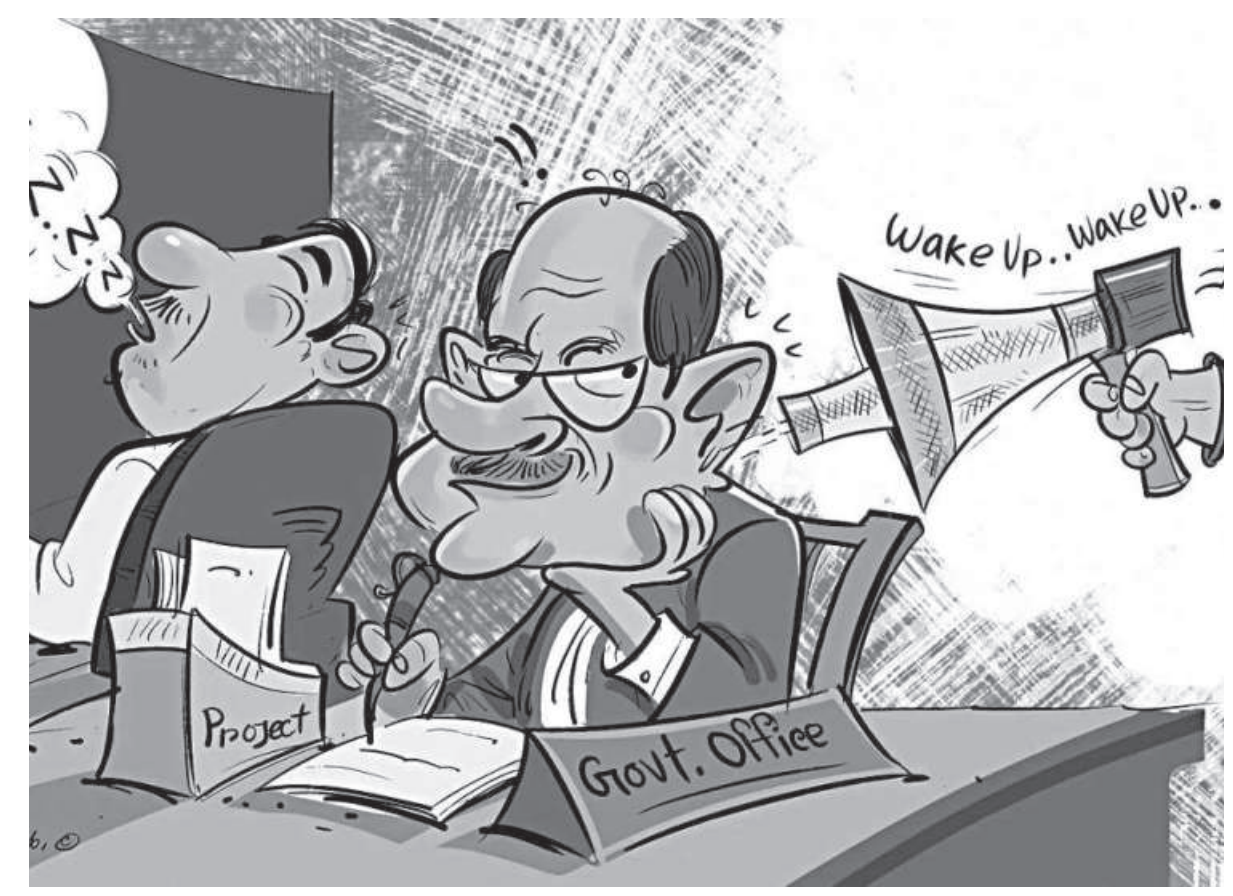
ILLUSTRATION: BIPLOB CHAKRABORTY

One has to admit that in public administration the role of that, "the government is on its toes bureaucracy emerges as the executor to take every step that will win them of public policy that are formulated over to its side". Concluding by saying by the political executive with inputs that: "Unless we restore elections from several sectors, including to their free and fair status, the the bureaucracy. The policies are and recommendations of the bureaucracy's power will continue then implemented through public bureaucrats. As such, bureaucrats organs and the proliferation of