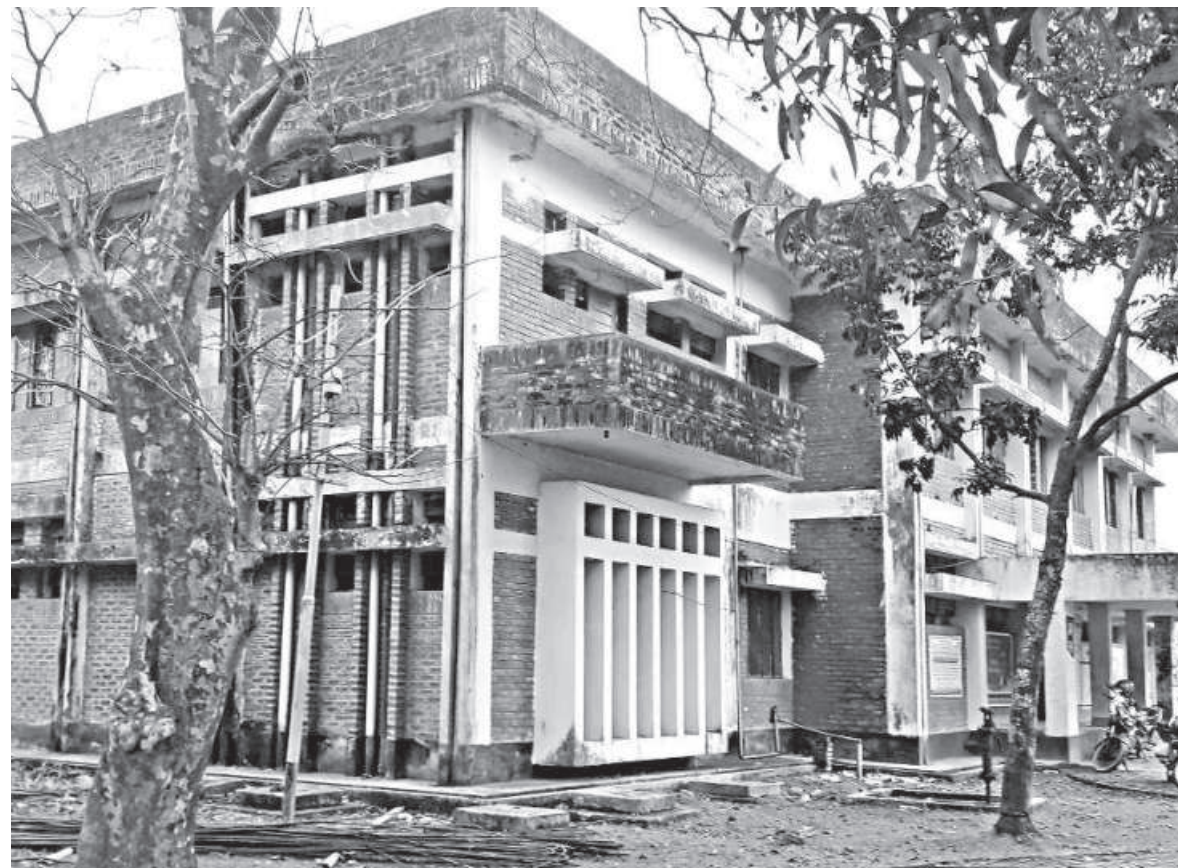
Around 400 patients who visit the 31-bed Khaliajuri Upazila Health Complex in a Netrakona haor will now be able to receive free X-Rays and pathology tests, almost 27 years after its establishment. However, the facility is severely understaffed, and the water ambulance sits idle due to lack of a designated driver.

But things have begun to change since last July. Although an X-ray machine had been lying idle at the complex for a long time, it couldn't be used because