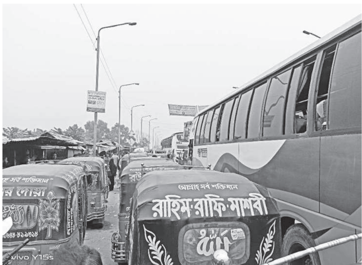
Inter-district buses are stuck in a gridlock at the entrance of Jamalpur's Brahmaputra bridge as CNG-run auto-rickshaws are parked on the road defying traffic rules. This illegal auto-rickshaw stand has been causing traffic jams in the area for decades, and still the authorities concerned continue to turn a blind eye.