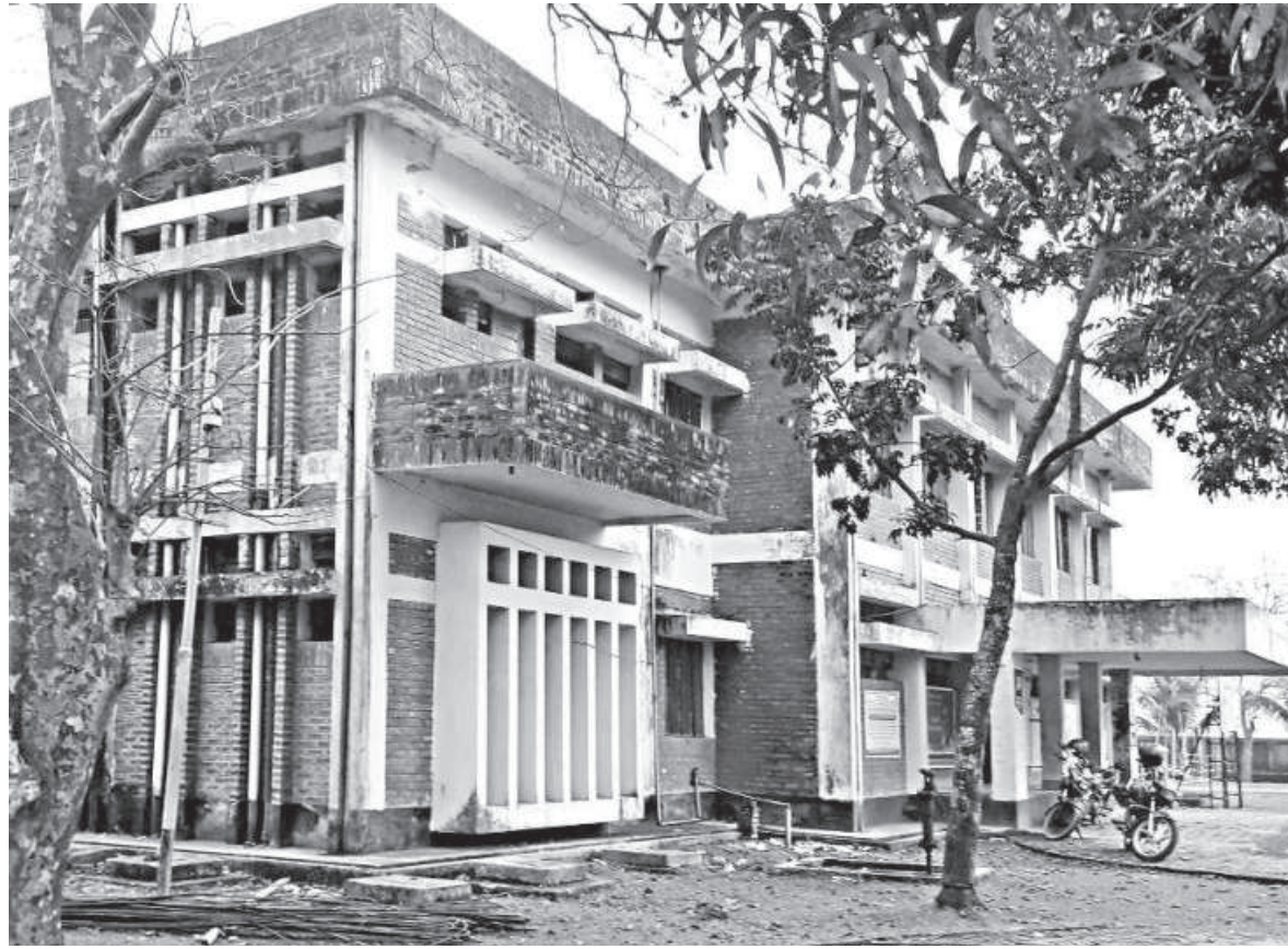
Around 400 patients who visit the 31-bed Khaliajuri Upazila Health Complex in a Netrakona haor will now be able to receive free X-Rays and pathology tests, almost 27 years after its establishment. However, the facility is severely understaffed, and the water ambulance sits idle due to lack of a designated driver.

But things have begun to change since last July. Although an X-ray machine had been lying idle at the complex for a long time, it couldn't be used because